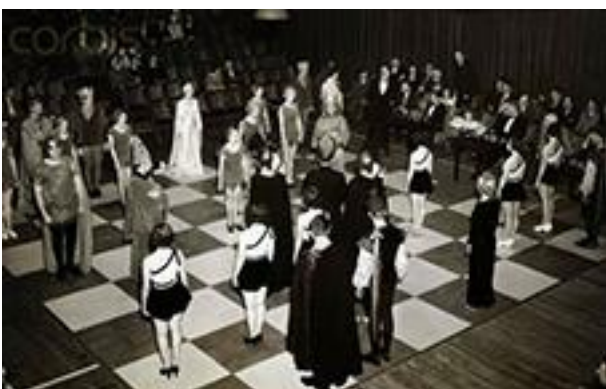
Figura 3- La sida Capablanca - Steiner

1933 - Capablanca e Steiner giocarono con pezzi umani a Los Angeles, Usa, l'11 aprile. Vinse Capablanca dopo 25 mosse.