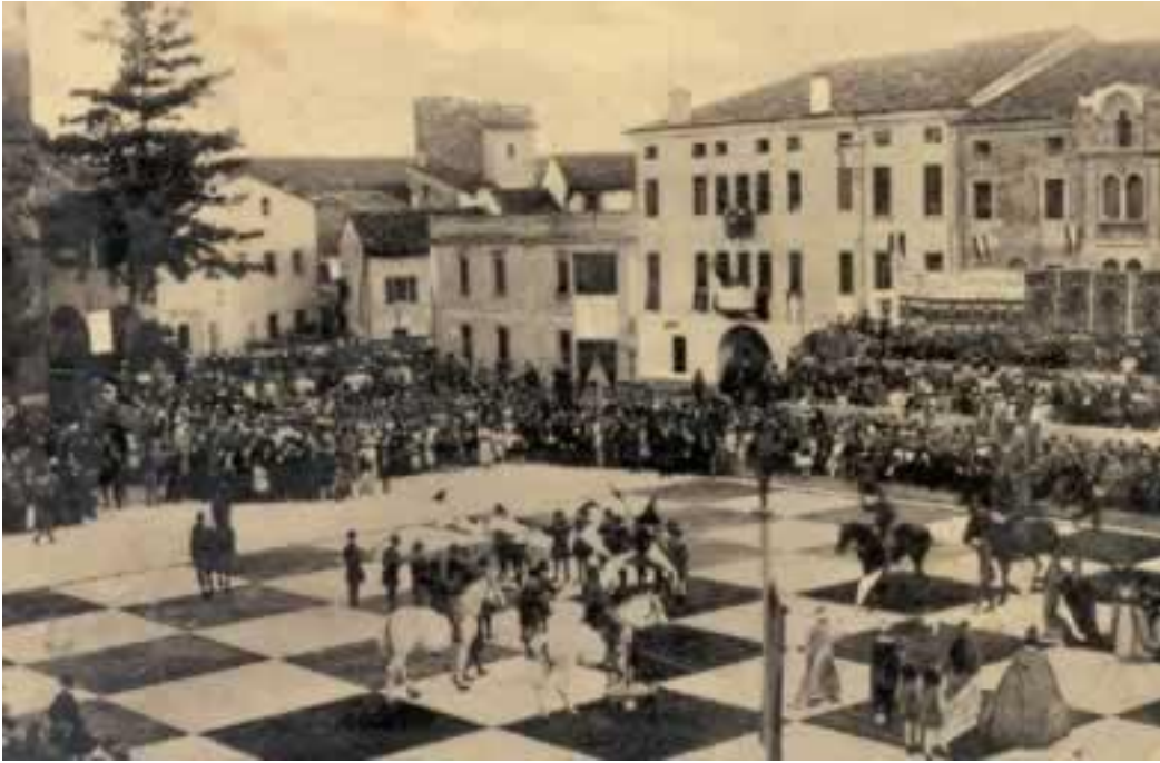
Figura 2 Marostica 1923

1924 - Solo l'anno dopo Marostica, 20 luglio 1924, si tenne un'altra straordinaria partita vivente sulla Piazza del Palazzo (allora Piazza Uritskij) a San Pietroburgo (all'epoca Leningrado). In quel giorno fu ufficialmente fondata la Federazione Mondiale degli Scacchi FIDE. Sulla scacchiera gigante si posizionarono i famosi giocatori Ilja Rabinovich (rappresentante dei neri) e Pjotr Romanovskij (pezzi bianchi); ogni pedina era rappresentata da persone reali: i soldati dell'Armata Rossa erano i pezzi bianchi e la Flotta Rossa i pezzi neri. I comandi dei due maestri di scacchi venivano trasmessi via telefono agli assistenti che, a loro volta, li annunciavano alle pedine viventi tramite un megafono. L'epica performance attirò circa 8.000 spettatori, che seguirono la partita dai bordi della piazza. La partita durò 5 ore e si concluse con un pareggio alla 67° mossa dei bianchi. Vedi il video