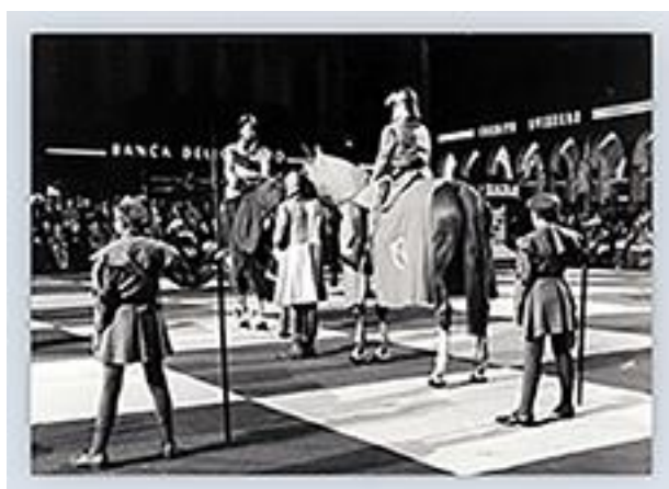
Figura 4 - Lugano 23 - 24 Agosto 1968 dal Corriere del Ticino

1968 – A Lugano nell’Archivio storico della Città le foto scattate da Vincenzo Vicari il 23 e 24 agosto 1968 quando piazza della Riforma ospitò un incontro di scacchi vivente in apertura del diciottesimo torneo olimpico. In quell’occasione fu rievocata «l’immortale» in un’epica partita disputata da Adolf Anderssen e Lionel Kieseritzkyi a Londra nel 1851.